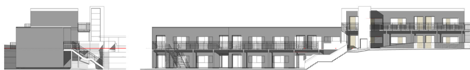
Opstalt, psykiatriboliger, syd.